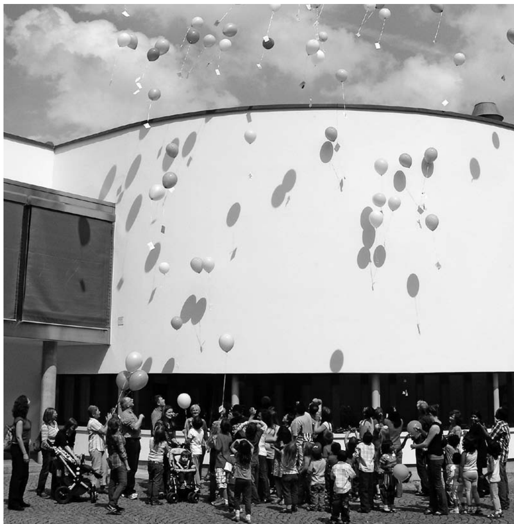
Unvergessliche Eindrücke beim «mit mir»-Fest 2010