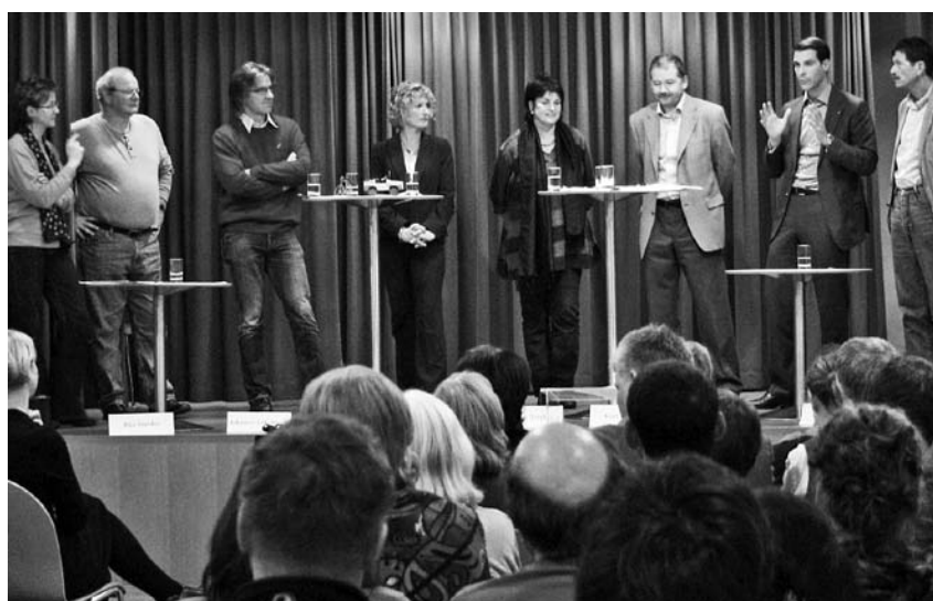
Podium beim Aargauer Abendforum «Armut im Aargau – Bei uns kein Thema?»