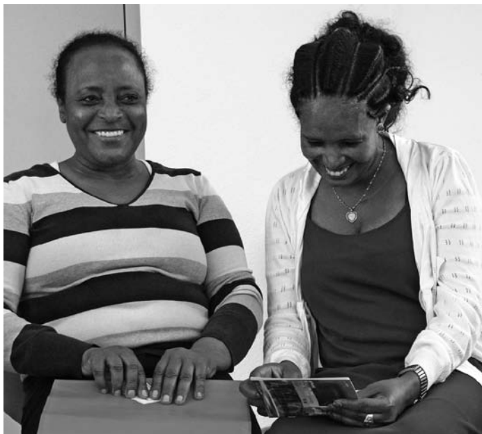
Auch im Kurs «Grüezi Eritrea» geht mit Humor alles besser

Der Start in ein neues Leben in einem unbekanntem Land ist mit viel Unsicherheit, Nicht-Wissen und Nicht-Verstehen verbunden. Wie kommen wichtige Informationen über das neue Land, über die Gepflogenheiten in den Lebensrucksack jedes Einzelnen?