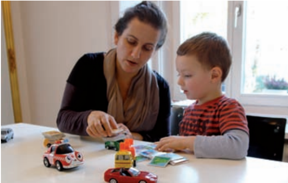
Mit einem Gottenkind gemeinsam Zeit verbringen und von seiner Welt erfahren.

«mit mir» heisst das Patenschaftsprojekt, in dem Freiwillige sich als Gotte oder Götti engagieren und an der Entwicklung eines Kindes teilhaben können.