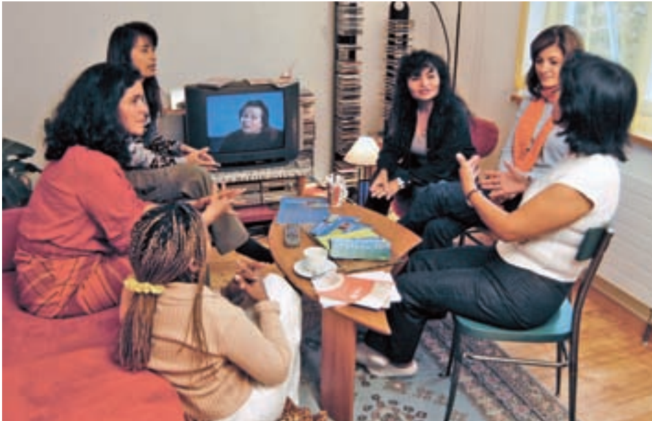
Angeregt diskutieren die Frauen bei FemmesTISCHE in ihrer Muttersprache über ein wichtiges Alltagsthema.

FemmesTISCHE heisst ein Projekt der Caritas Aargau, in dem sich Migrantinnen in ihrer Muttersprache vernetzen und austauschen. Am Stumentisch diskutieren sie über Themen wie Erziehung, Gesundheit und ihre Erfahrungen in der Schweiz.