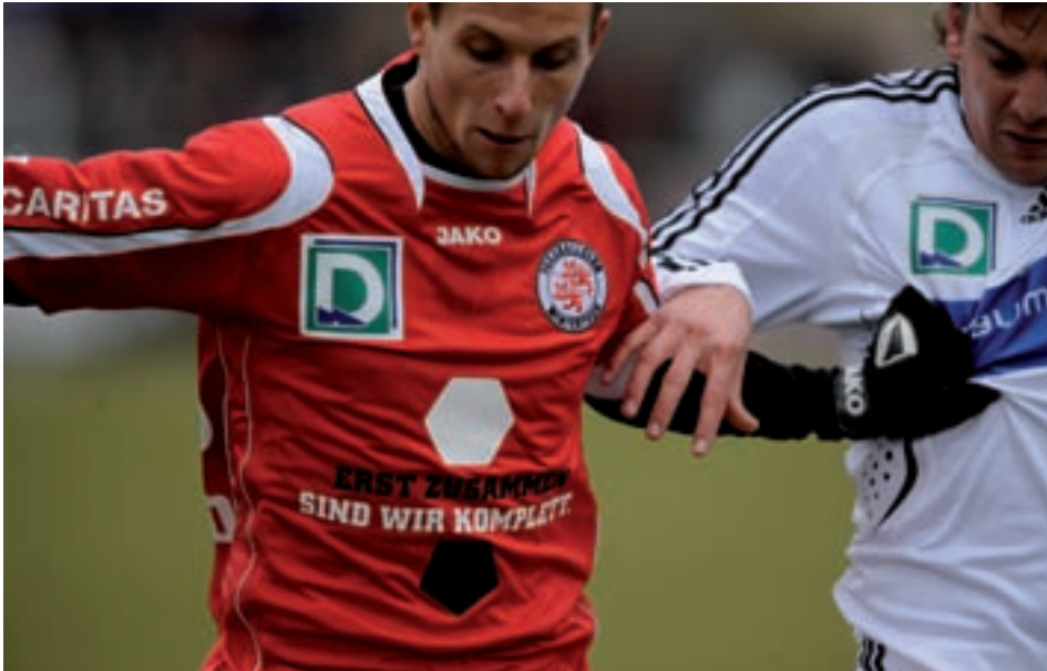
Die Trikots der FCW-Spieler werden in der Rückrunde vom Caritas-Logo und unserer Kampagne «Erst zusammen sind wir komplett.» geschmückt

«Erst zusammen sind wir komplett», unter diesem Titel starten der FC Winterthur und Caritas Zürich das gemeinsame Projekt «Wintegration».