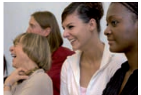
Transfer führt Menschen zusammen

Auf vielfältige Art vermittelt «Transfer» Fach- und Hintergrundwissen zu transkulturellen Kompetenzen und stellt gleichzeitig den Transfer in den Alltag her. Die Teilnehmenden bewegen sich in verschiedenen kulturellen Kontexten, Altersgruppen und Lebenswelten. Sie fördern Prozesse bei Gruppen und Einzelnen und suchen gemeinsam Lösungen. Die Teilnehmenden können in ihrem näheren oder weiteren Umfeld Aktivitäten zur Integration und Rassismusbekämpfung anregen.